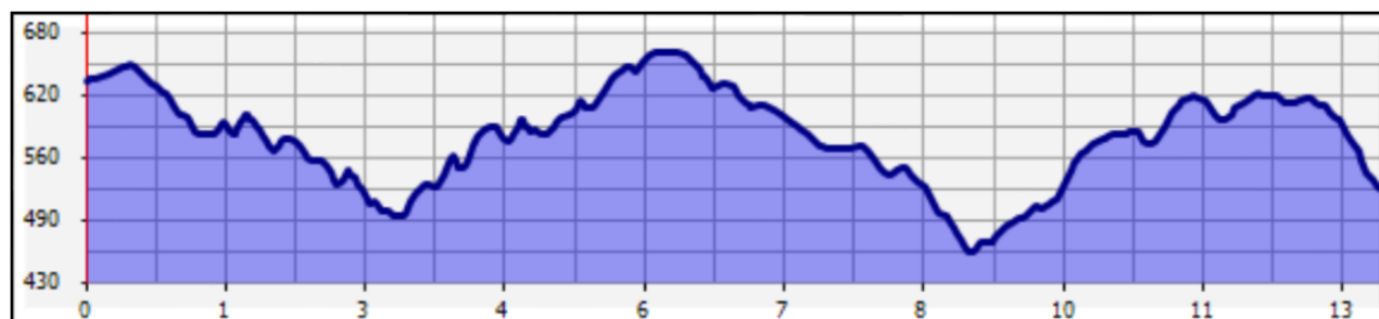
Höhenprofil zur Heilige-Tage-Wanderung am 28.12.2019