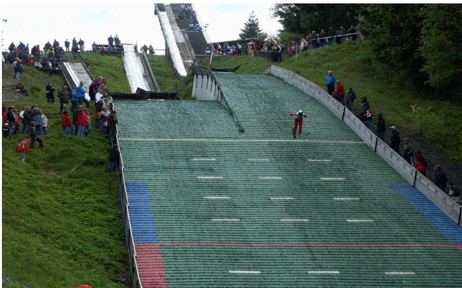
Ausrichter Ski Klub Winterberg