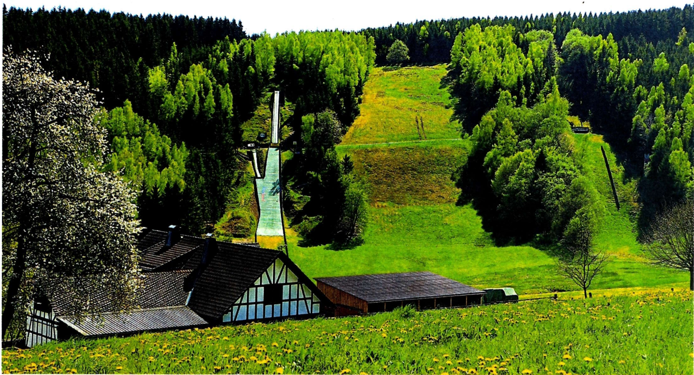
Die neue und alte Lahntalschanze in Rückershausen.