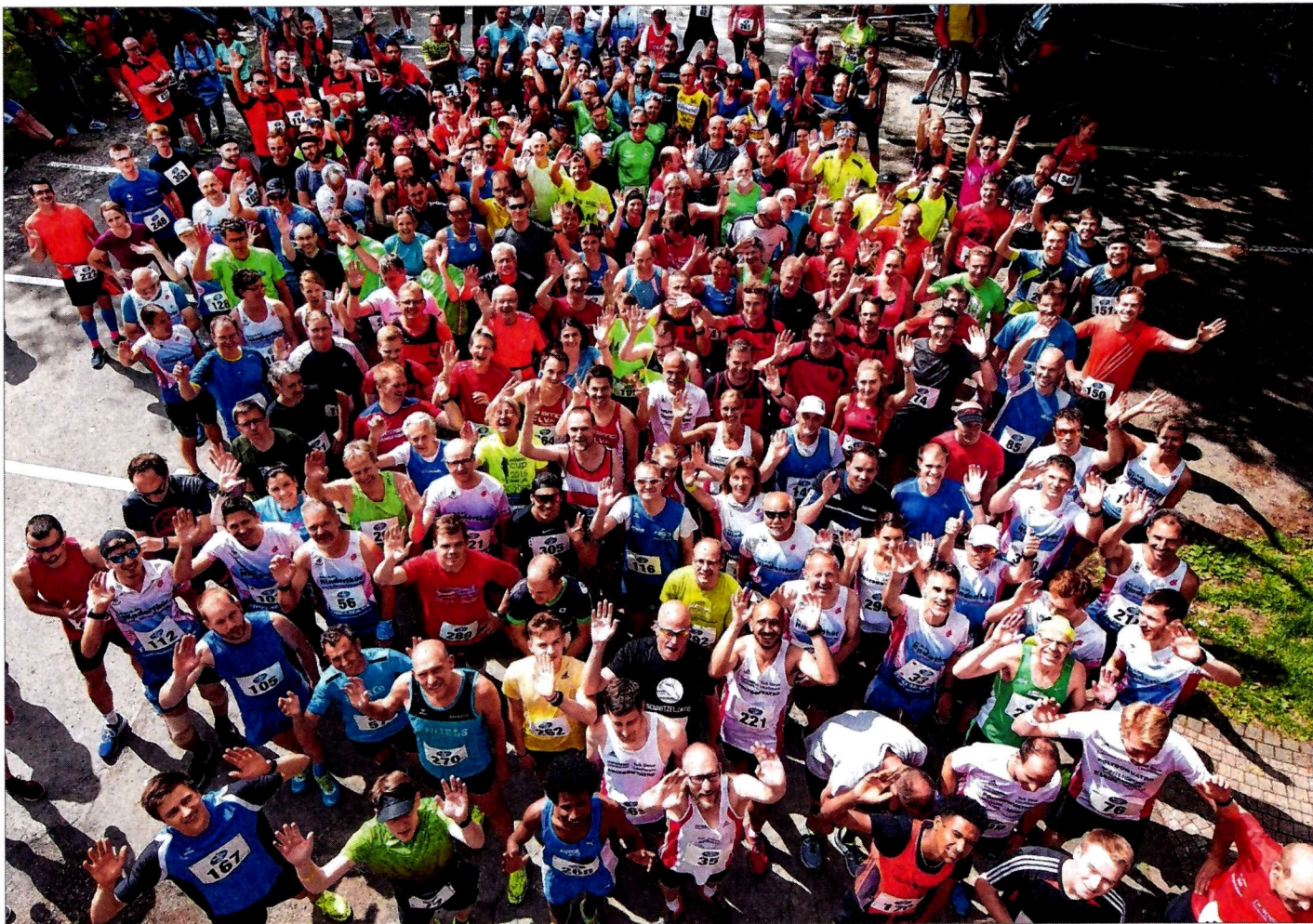
Das Starterfeld über 15 Kilometer beim 30. Deuzer Sparkassen Pfingstlauf aus der Vogelperspektive. Insgesamt gingen diesmal 417 Läuferinnen und Läufer an den Start. Es war der 3. Lauf zum Ausdauer-Cup 2019.