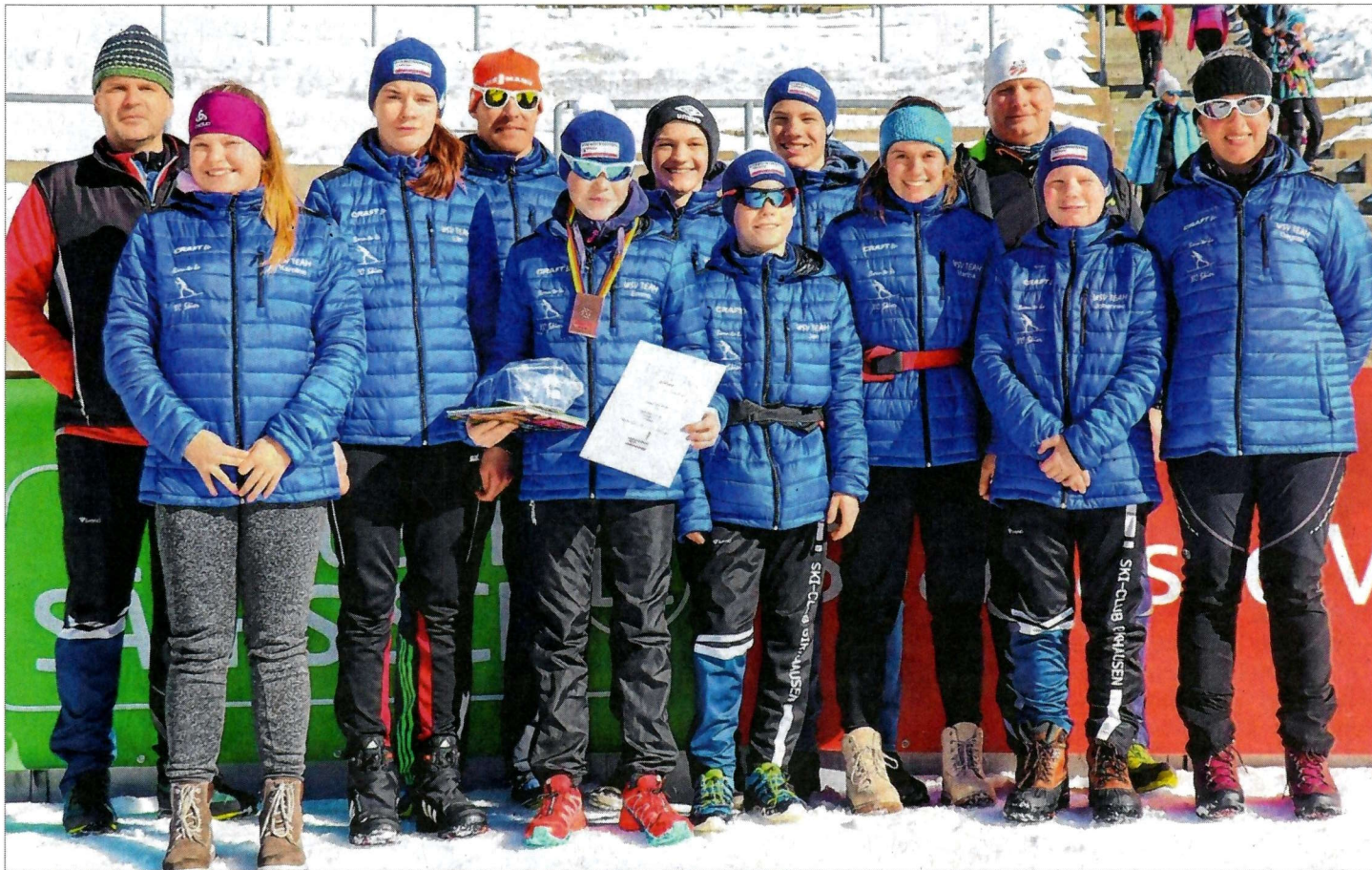
Der Westdeutsche Skiverband war mit zahlreichen Startern beim Schülercup des Deutschen Skiverbandes in Klingenthal am Start – darunter waren auch einige Wittgensteiner.