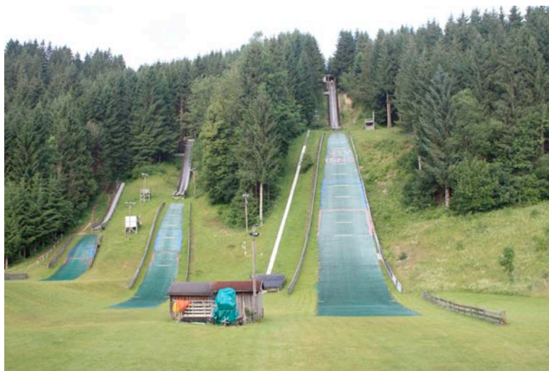
Isny im Allgäu