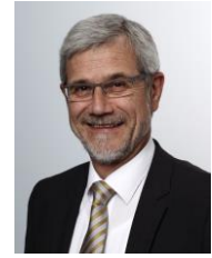
Klaus Pavel Landrat des Ostalbkreises

Dem Organisationsteam und den Helfern des TV Weiler in den Bergen wünsche ich für die Durchführung der Veranstaltung gutes Gelingen. Den Fans des Wintersports wünsche ich spannende Wettbewerbe und für alle Teilnehmerinnen und Teilnehmer hoffe ich auf gute Wetter- und Schneebedingungen, damit sie bei fairen Wettkampfbedingungen ihr bestes geben können und die Meisterschaft zu einem unvergesslichen Event werden lassen.